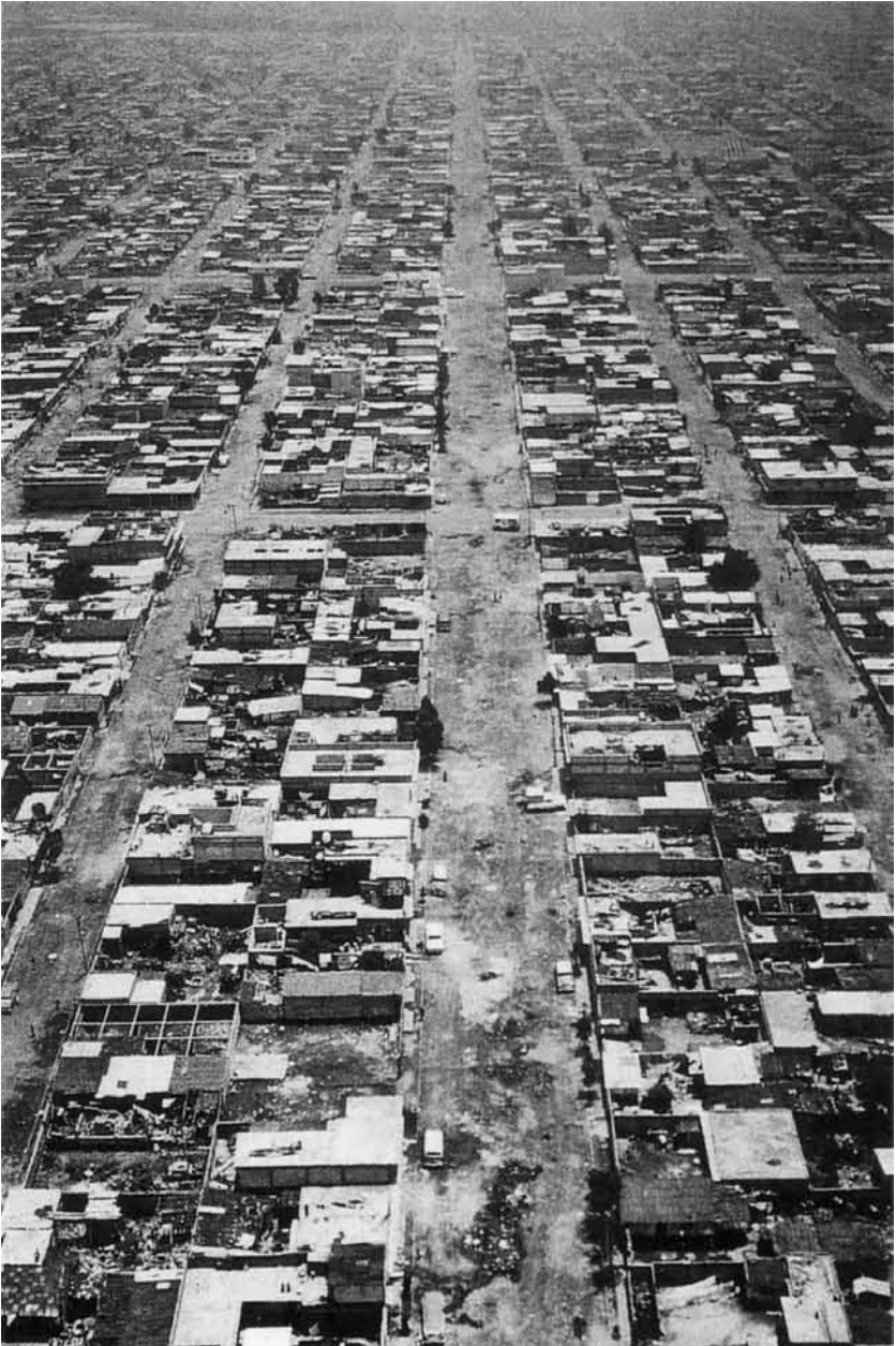
Deux exemples de l'extension du lotissement dans la ville de Mexico.