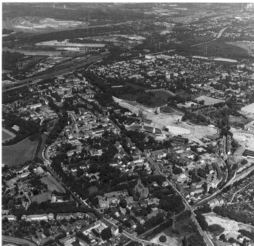
Vue aérienne de Gelsenkirchen-Bismarck et de ses environs, juin 1996.