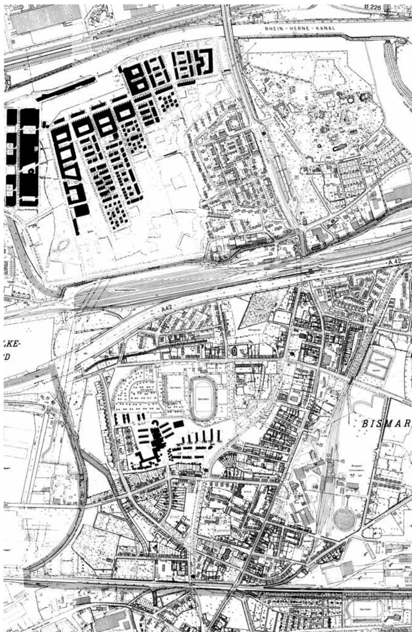
Programme de développement du quartier Bismarck/Schalke-Nord, 1995.