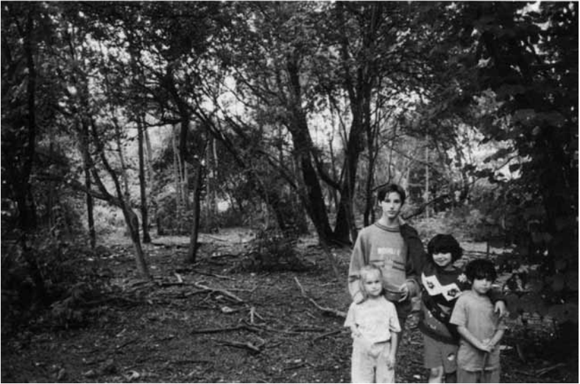
Échangeur Cologne-est. Bois, quartier Poll.