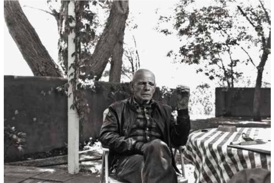
John Brinckerhoff Jackson dans sa maison de La Cienega, Nouveau-Mexique, 1988.

J. B. Jackson Pictural Materials Collection, Center for Southwest Research and the School of Architecture and Planning, University of New Mexico.