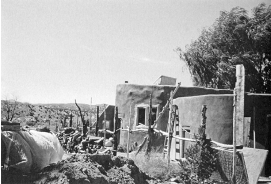
Habitat indien, Nouveau-Mexique, octobre 1980.