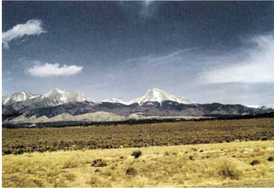
Photographie de J.B.Jackson, Paysage, San Luis Valley, Colorado, avril 1967.

J.B.Jackson Pictorial Materials Collection, Center for Southwest Research and the School of Architecture and Planning, University of New Mexico.