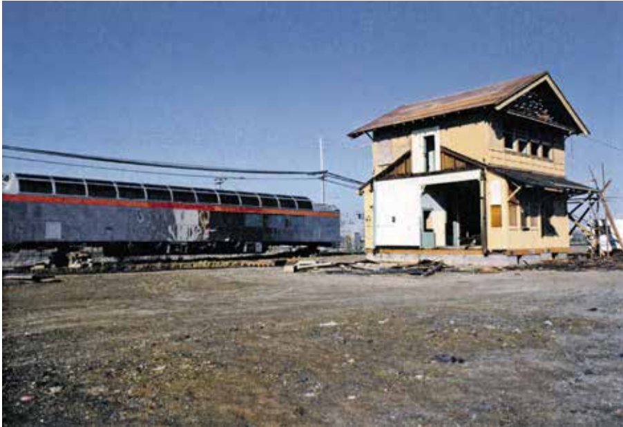
Photographie de J.B.Jackson, février 1975.

J.B.Jackson Pictural Materials Collection, Center for Southwest Research and the School of Architecture and Planning, University of New Mexico.