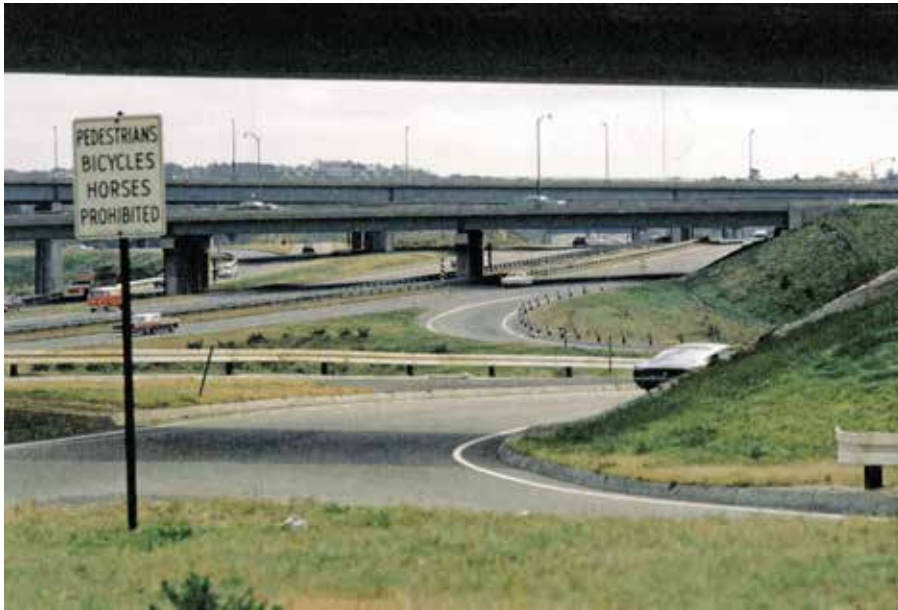
Photographie de J.B.Jackson, Nœud autoroutier et panneau, Massachusetts, octobre 1969.

J.B.Jackson Pictorial Materials Collection, Center for Southwest Research and the School of Architecture and Planning, University of New Mexico.